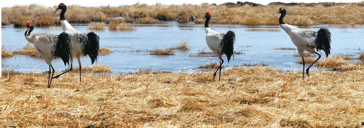
3月底,在若尔盖湿地花湖区域拍摄到的黑颈鹤。

我是黑颈鹤“小黑”。最近,我们黑颈鹤家族陆续开启了北归之旅。3月13日,作为第一批飞回四川若尔盖花湖湿地的黑颈鹤,我和其他3位小伙伴如约抵达花湖,准备在这里度过我们的恋爱繁殖季。