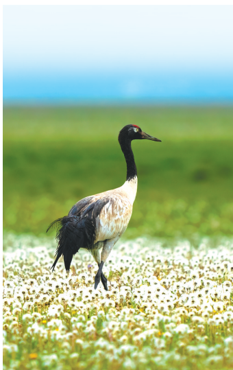
若尔盖湿地的黑颈鹤。

我们黑颈鹤有哪些特点?在哪里可以看到我们的身影呢?今天,和我一起“飞进”黑颈鹤的世界吧!