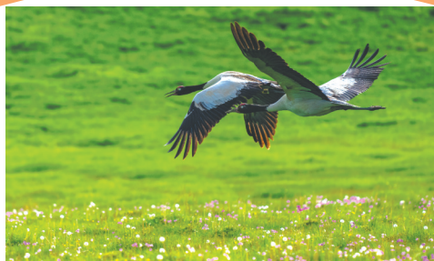
在若尔盖湿地翩然飞翔的黑颈鹤。