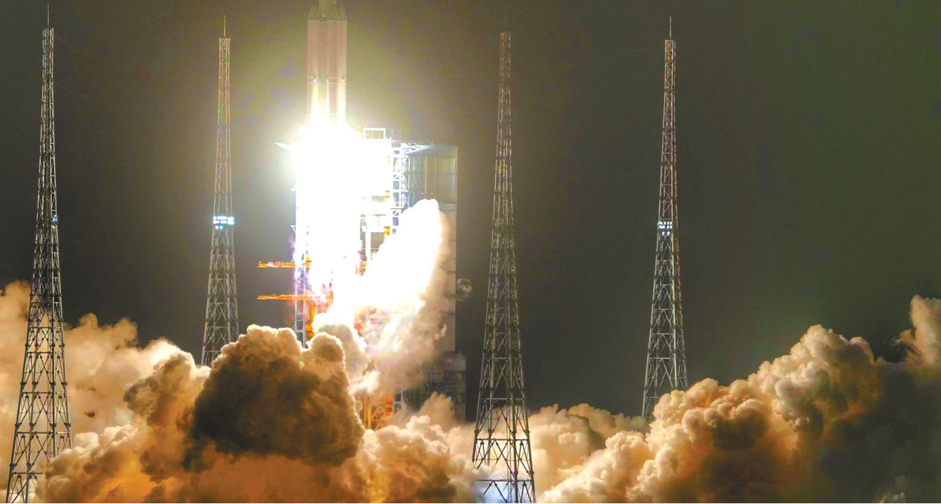
1月17日，搭载天舟七号货运飞船的长征七号遥八运载火箭，在海南文昌航天发射场点火发射。

天舟七号有什么特别？它超厉害，是可以携带约5.6吨物资的大家伙，是世界现役货物运输能力最大、货运效率最高、在轨支持能力最全的货运飞船。