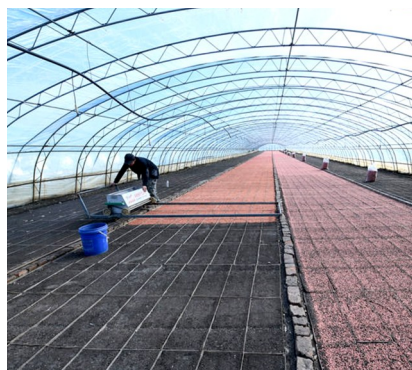
4月4日,在黑龙江北大荒农业股份有限公司友谊分公司一水稻育秧大棚里,农业职工在进行播种作业。图据新华社客户端

州澳宗生物科技有限公司负责人说,这款新药的另一适应症是儿童自闭症,有望打破全球儿童自闭症领域“无药可用”的现状。