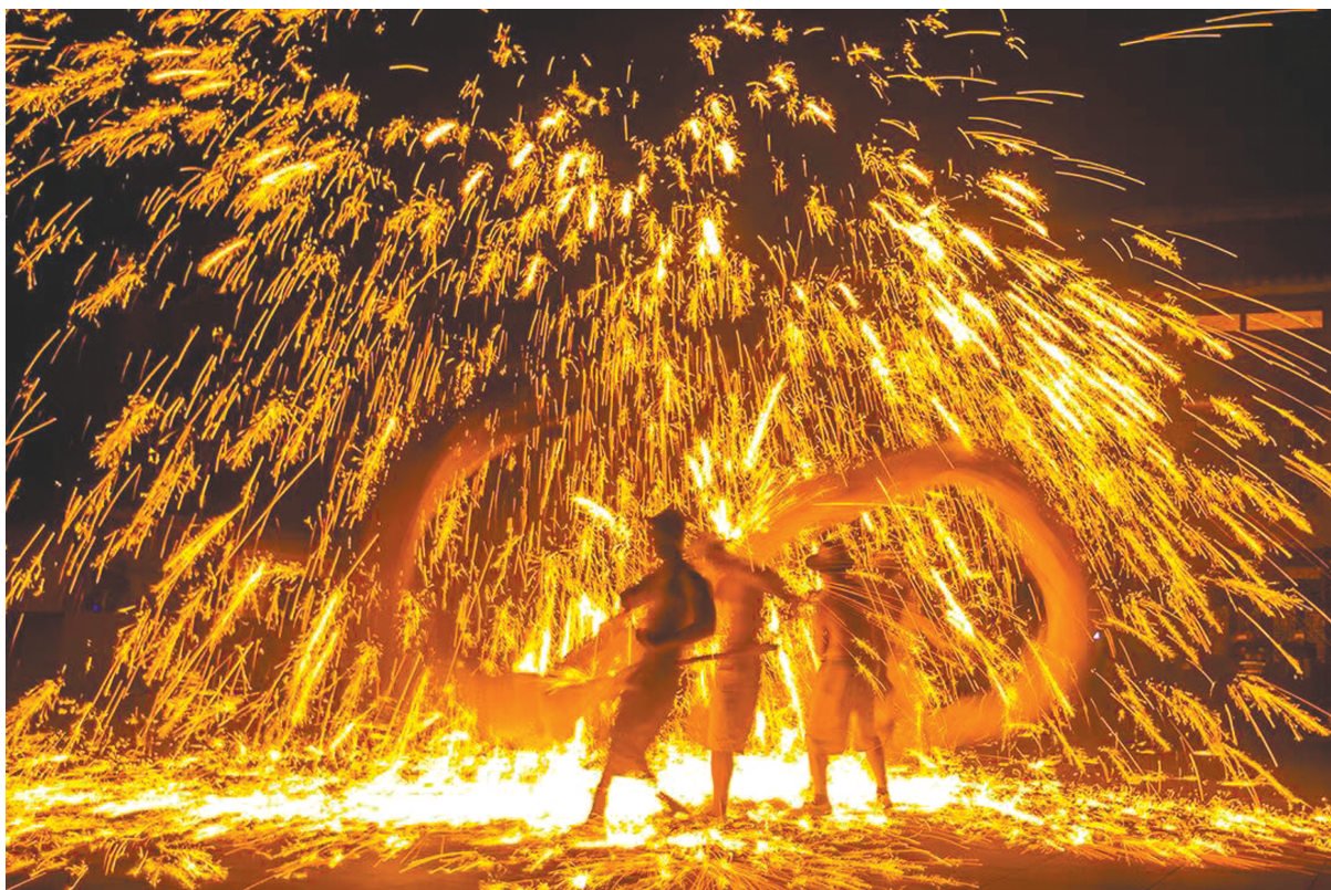
黄龙溪烧火龙表演，成千上万金色火花点亮了夜空。