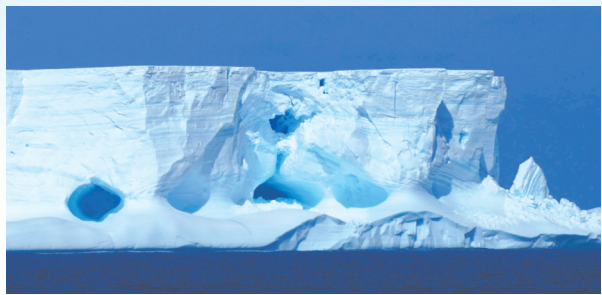
南极大陆威德尔海的海上冰山。

“全球气候变暖给人类带来了很多问题,如极端灾害天气频发、冰川融化、海平面上升等等。不过,全球气候变暖还可能影响地球角速度的变化,影响到世界时间的变化。