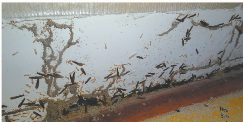
搬离家具后发现大量活体白蚁。