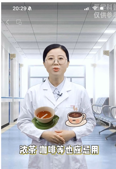
万木健康数字医生应用案例截图。

制作成本约在 40 美元左右，相较于此前需要专业级影棚、专业图形处理软件数以百万计的成本，实现了降本增效。