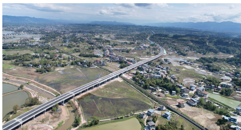
开梁高速四川段报恩寺村特大桥。

县、达川区及重庆市梁平区20多个乡镇,面积达2500平方公里,受益人群达150多万人,将极大地改善沿线地区交通环境和促进生态旅游发展,加强达州市及开江县与重庆市及梁平区的