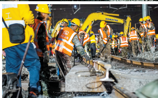
施工现场。