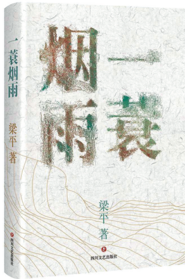
《一蓑烟雨》

人的缝隙”。所以，我很乐意让“我”出场。这个“我”，不是一己之私，而是一种人格塑造、精神谱系。”