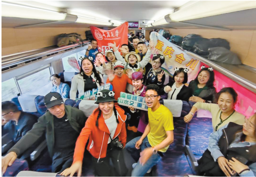
参加2024成都双遗马拉松比赛的重庆跑友坐上了首趟渝都直通动车。

记者看到，车厢内精心布置了熊猫玩偶、彩带，可爱而温馨。为了宠游客，都江堰还为乘坐本次列车的游客精心准备了文旅盲盒，包括诸多热门景点门票，成都大运会吉祥物蓉宝纪念玩偶、镇水神兽文创产品、猕猴桃果酒、文创糕点等伴手礼，以及茶溪谷、道茶观光园、猪圈咖啡、特色民宿等休闲旅游项目体验券。