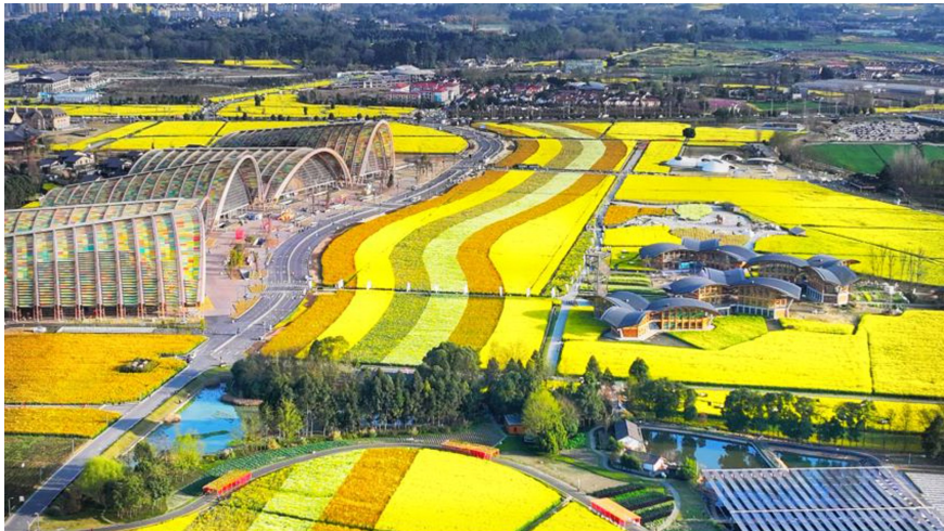
俯瞰天府农博园大田景观。

成都世园会新津分会场最大的特色亮点就是将围绕农艺主题,展示乡村四季特色场景。在这里,将突出“农艺展示、农事体验”,打造内外联动场景。依托天府农博园“一馆一轴、一环三区、N点协同”的空间布局,营造“一田、两带、三