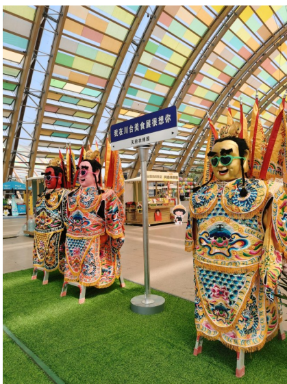
3月20日,川台美食展在天府农博园开展。

馆、四片”展陈场景,并在室外呈现3000亩农艺大田展区和农艺主展、农艺游赏两个景观带,联动4大农事体验片区,在室内打造天府粮仓特色农产品展销、现代农业科技展示、天府农耕文明博物3大展馆,形成场馆内外联动、相互呼应的乡村特色场景。