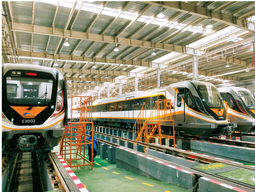
轨道交通资阳线临空车辆段内准备投入运营的列车。

目前，轨道交通资阳线全线7座车站全部结构已封顶，已实现桥通、洞通、轨通、环网电通、车辆基地接车等节点目标，各站点正全面开展机电装修工程，向着实现年内开通初期运营的目标全速推进。