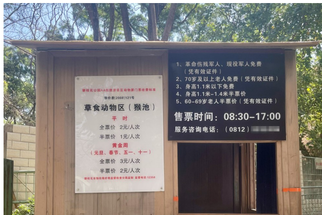
◀门票平时2元/人，攀枝花动物园被网友称为“良心动物园”。

动物自身的实际身体状况，让它动起来，增加运动量。比如，不把食物直接扔给动物，而是放置在高处或远处，让金钱豹必须跳跃、奔走或攀爬才能得到食物。“改变投喂的方式，也会给饲养的动物带来乐趣，减少环境单调和缺少变化对它们心理造成的不利影响。”同时，孙全辉表示，空间有限的地方不建议投喂活食，因为捕食过程可能造成金钱豹的意外伤害。