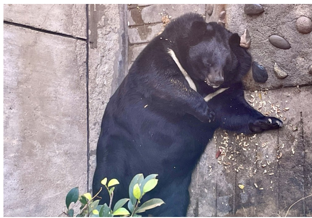
◀动物园内长得圆滚滚的黑熊。