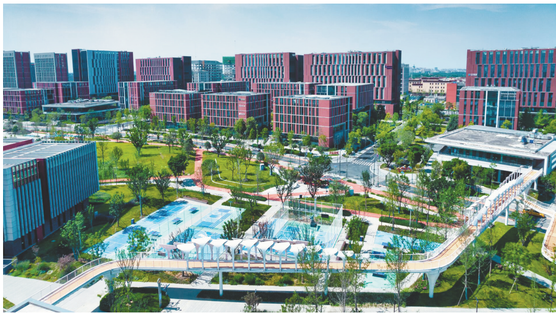
成都天府国际生物城。