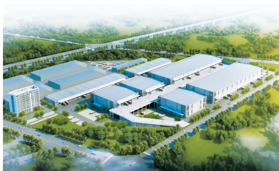
成都转化多式联运智慧枢纽项目效果图。

础设施体系，编列一批重大基础设施项目，全力推动扩大有效益的投资，更高水平促进消费投资良性循环。聚焦加快传统网络基础设施建设，编列了成都五环路等交通基础设施项目47个，三坝水库、川投集团简阳燃气电站新建工程等项目26个，推动基础设施投资“压舱石”作用充分彰显。