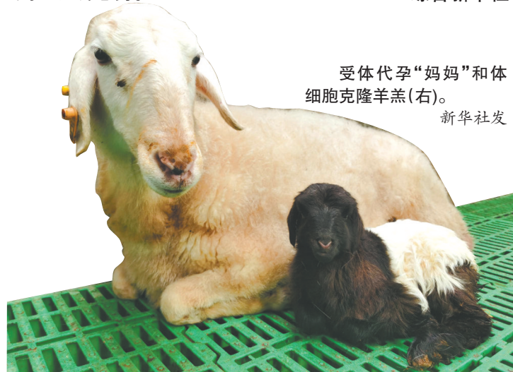
受体代孕“妈妈”和体细胞克隆羊羔(右)。

在整个克隆实验的43只受体羊中,有超过半数成功怀孕,并在后续的检查中显示出了良好的发育态势。