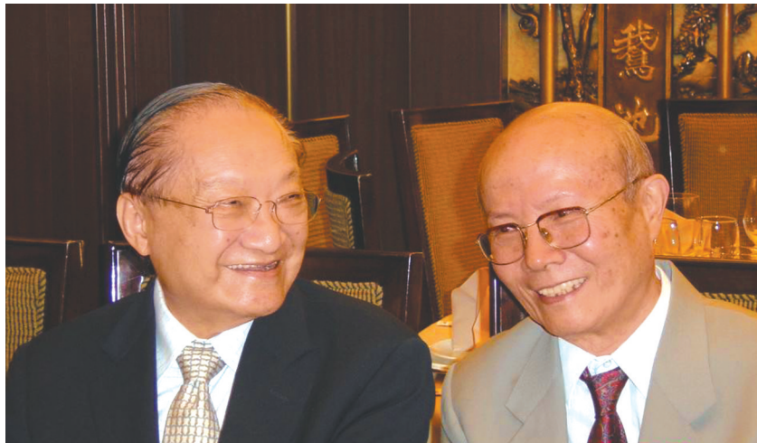
金庸先生与严家炎教授(右)。

金庸百年诞辰，多个地方举办纪念活动。2024年3月10日凌晨，湖北省襄阳市金庸迷在襄阳古城墙上点亮烛火，以此纪念金庸先生百年诞辰。另据了解，“侠之大者——金庸百年诞辰纪念”活动将于3月15日至7月2日在中国香港举办，公众可免费入场。届时，由雕塑家创作的10尊金庸角色人物雕塑，包括小龙女、杨过、周伯通等，将公开展出。场内还设有灵感来自《射雕英雄传》的蒙古包，通过多语言语音导航及增加现实(AR)科技，为游客带来沉浸式体验；多个还原小说情景布置及经典服装造型的打卡位，不仅唤起大家的集体回忆，更可拍照留念。