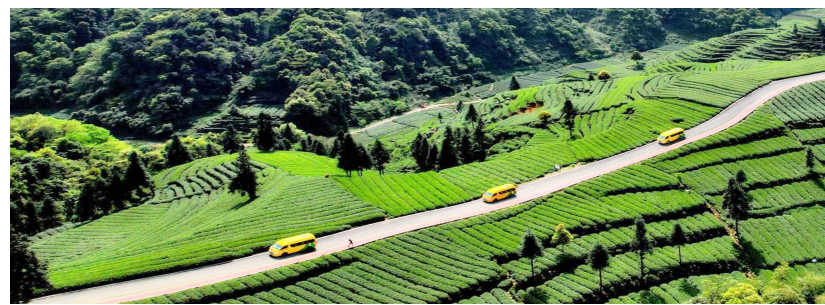
雅安名山区农村公路。

《指南》适用于四川省行政区划内旅游公路新建、改扩建及提升旅游服务功能的专项工程。这里提到的旅游公路主要包括普通国道、普通省道和农村公路，有旅游服务需求的高速公路和专用公路可参照使用，对于纳入非交通行业管理的旅游公路，应采用相应的国家标准或行业标准。