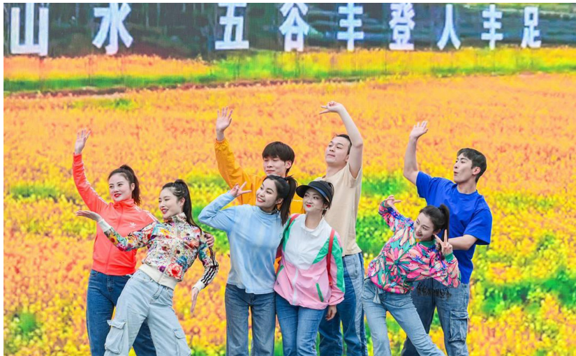
2024年四川省春季文旅推介活动将舞台设在烂漫的油菜花地。

让更多人能共享四川春日“花景”，共品春日“蜀味”。其中，线下不仅可打卡柳江玉屏旅游度假区大片彩色的油菜花，还可前往茶客空间体验春茶采摘等；线上发布“天府粮仓乡村之旅”、“赏花踏青采摘之旅”等多条春季旅游线路，内容涵盖洪雅瓦屋山景区—柳江玉屏旅游度假区—七里坪旅游度假区—槽渔滩—青杠坪·茶客空间—止戈桑果园—朴那雅旅游度假区—光明寺—中保漫花田野—雅女湖—春驿花园等洪雅适合春季旅游的打卡点。