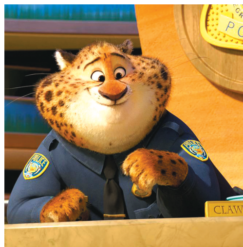
《疯狂动物城》中的豹警官。