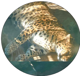
躺平的“胖豹”。

3 我们来仔细看看《疯狂动物城》中的“豹警官”,虽然因为喜欢吃甜甜圈而长得过于肥胖,失去了“苗条”的身材,但其黑色斑点的花纹,以及眼下的两条黑色“泪痕”都说明,它其实是一只猎豹。所以,四川“胖豹”和“豹警官”的确是不同的哦!