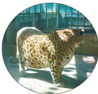
攀枝花市公园动物园区内形体肥硕的花豹。

看到这里,有的人可能会小看我,但要知道,我可是陆地上跑得最快的动物!经过测算,我奔跑的最快速度可以达到每小时100公里左右,比高速公路上的很多小汽车还要快。而且,我从静止加速到最快速度,通常不超过4秒!如果花豹和我比赛跑步,说不定连我的尾巴都摸不到。