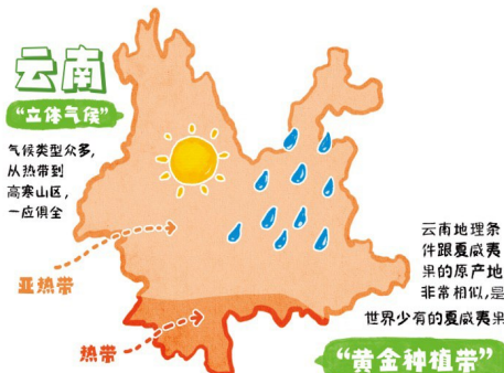
云南种植夏威夷果的地理优势 制图 罗乐