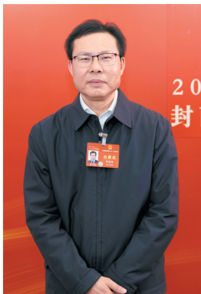
全国人大代表、四川省生态环境厅厅长钟承林

水质首次“100%”达到优良标准，国考断面水质优良率居全国第一。在厚植美丽四川的生态本底上，全省近三分之一的面积纳入生态保护红线，森林覆盖率达35.72%。在增强绿色动能上，四川在全国率先印发实施碳市场能力提升行动方案，全面推进国家清洁能源基地和清洁能源示范省建设，成为人均碳排放量最少省份之一。