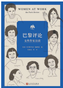
《巴黎评论·女性作家访谈》

至90后女作家的优秀作品。书中讲述的20个动人故事，展现出开阔、敏锐而多彩的女性视角。