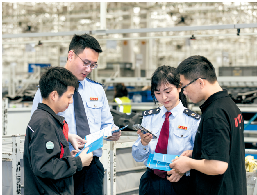
税务干部前往企业向一线工作人员普及个人所得税汇算清缴政策。