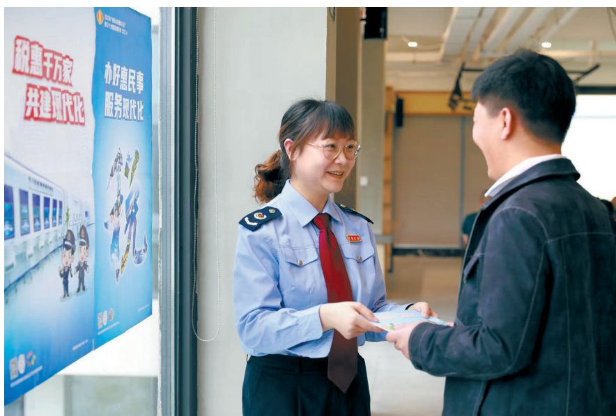
税务干部“面对面”向纳税人讲解税费优惠政策适用条款。