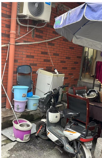
居民楼有人随意拉线充电。