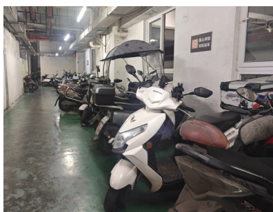
电动自行车在“禁止停车”区域停放。

电也很恼火，打不得骂不得，有些业主只顾自己方便，就喜欢停在最近的电梯口附近，我们也只能劝阻业主停在规定的停车处。如果沟通不成，我们只有帮助其抬到停车处。”一小区物业人员对记者抱怨道，物业在管理中大部分时候处于劣势，对于上述行为能做的只有劝阻。