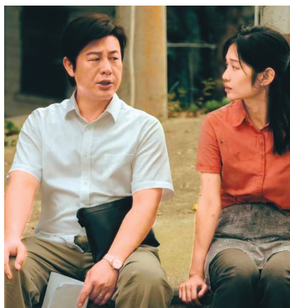
《猎冰》由张颂文(左)主演。图图片方

2月21日，《猎冰》于腾讯视频上线。这部由高群书导演，张颂文、姚安娜主演的电视剧，是张颂文继《狂飙》后播出的首部电视剧，上线当天站内热度值便突破25000。