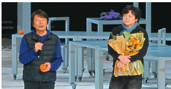
刘震云亮相四川大剧院。

“以为来日方长，谁料一日三秋，亦真亦假，全做笑话。”著名作家刘震云的超现实主义长篇小说《一日三秋》以笑话之名，给“社死”和流亡他乡的人以新生。2月23日晚，根据刘震云同名小说改编，丁一滕导演，唐诗逸、徐均朔、李腾飞、张睥子、金广发、冯田等主演的话剧《一日三秋》，在四川大剧院首演。演出结束后，刘震云惊喜亮相并点赞：“这是一台具有经典气质的、优秀的话剧。”