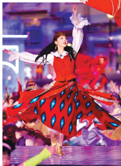
热巴穿的艾德莱斯舞裙是用非遗技艺制作。