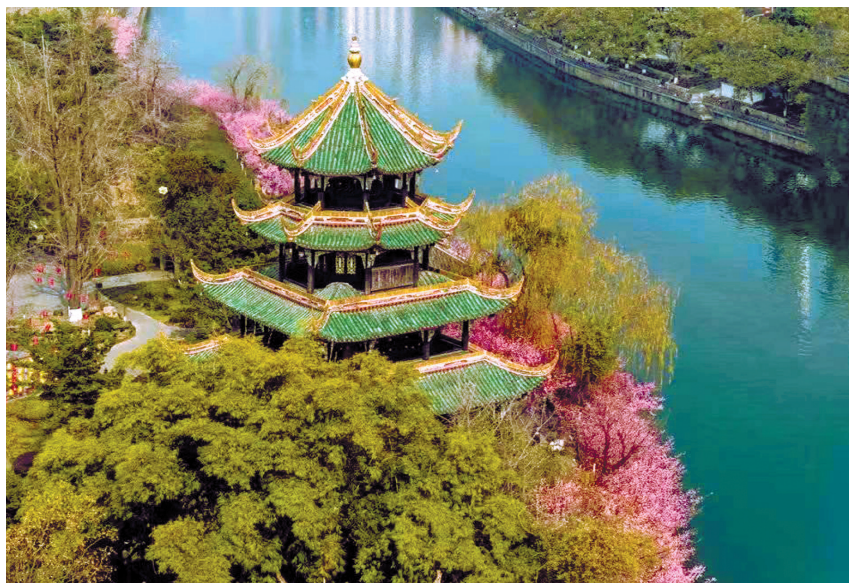
望江楼公园春色。

公园城市春花观赏指数共分Ⅲ级，具体为：观花指数Ⅰ级：开花率为10%-35%之间，较适宜；出游观赏观花指数Ⅱ级：开花率为35%-60%之间，适宜出游；观赏观花指数Ⅲ级：开花率为60%-95%之间，为观赏最佳时期。