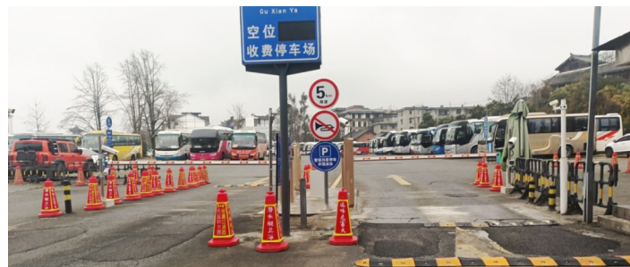
都江堰古县衙停车场

市民朋友可通过手机微信进入“成都停车APP”小程序,在首页点击“共享停车”,选择所需的智慧共享停车点位,按步骤完善信息后在线下单即可。现阶段,3个智慧共享停车点位的共享时段为18:00至次日9:00,市民选择智慧共享停车服务后,在共享时段内停车的费用为每月60元,需要特别注意的是,在18:00前将车辆驶入共享停车点位或次日9:00前未将车辆驶出的将另行计取停车费用。