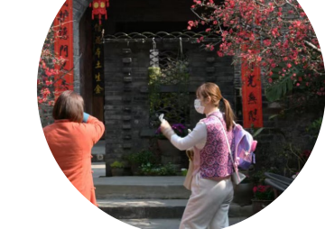
游客在客栈里拍照。

写福字、写春联贴在自己房间门口。小院里提供围炉煮茶，天南地北的客人坐在小院里晒着太阳，喝茶聊天。还有组织小朋友们做手工红包，做好后，管家会包上几块钱送给小朋友。