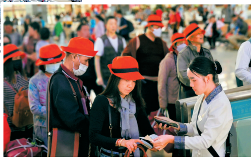
▼1月26日，在老挝万象，旅客在中老铁路万象站检票乘车。

国家统计局数据显示，1月份，受节日效应影响，居民消费需求持续增加，全国居民消费价格指数(CPI)环比上涨0.3%，连续两个月上涨。