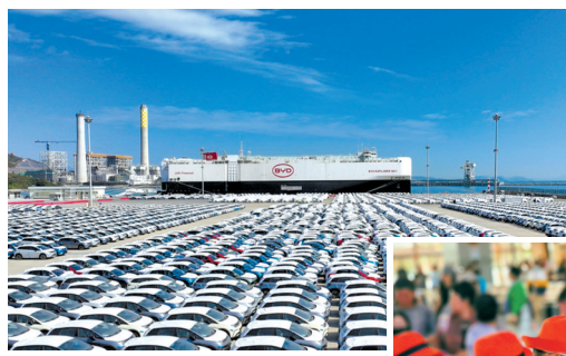
▲1月14日，“BYD EXPLORER NO.1”（比亚迪“开拓者1号”）滚装船抵达深圳港小漠国际物流港。