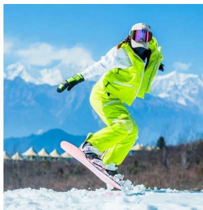
游客在雅安王岗坪体验滑雪。