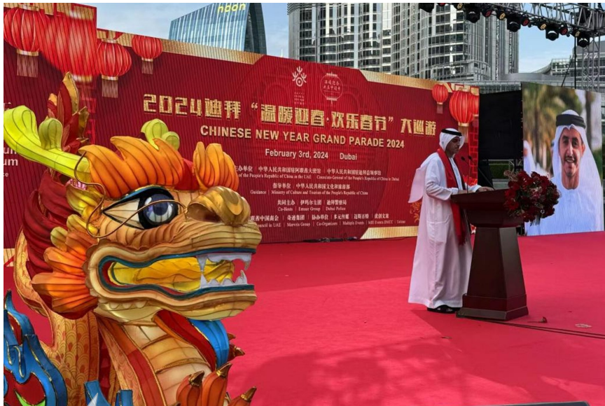
自贡彩灯亮相迪拜“欢乐春节”大巡游主舞台。

据介绍,“吉祥龙”是此次迪拜“欢乐春节”大巡游的吉祥物,材质主要以铁丝、矩形管等传统制灯材质为主,采用