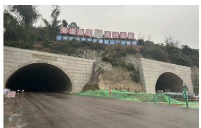
梨花山隧道洞口与路基同宽

华西都市报(记者 曹菲 摄影报道)全长约42公里、东西向横穿天府新区,通车后将有效缓解成名、成雅高速通行压力……今年6月底,四川天府新区至邛崃高速(以下简称“天邛高速”)将建成通车。1月30日,记者来到天邛高速唯一一座隧道——梨花山隧道探访,揭秘这座隧道如何实现车辆不减速通行。