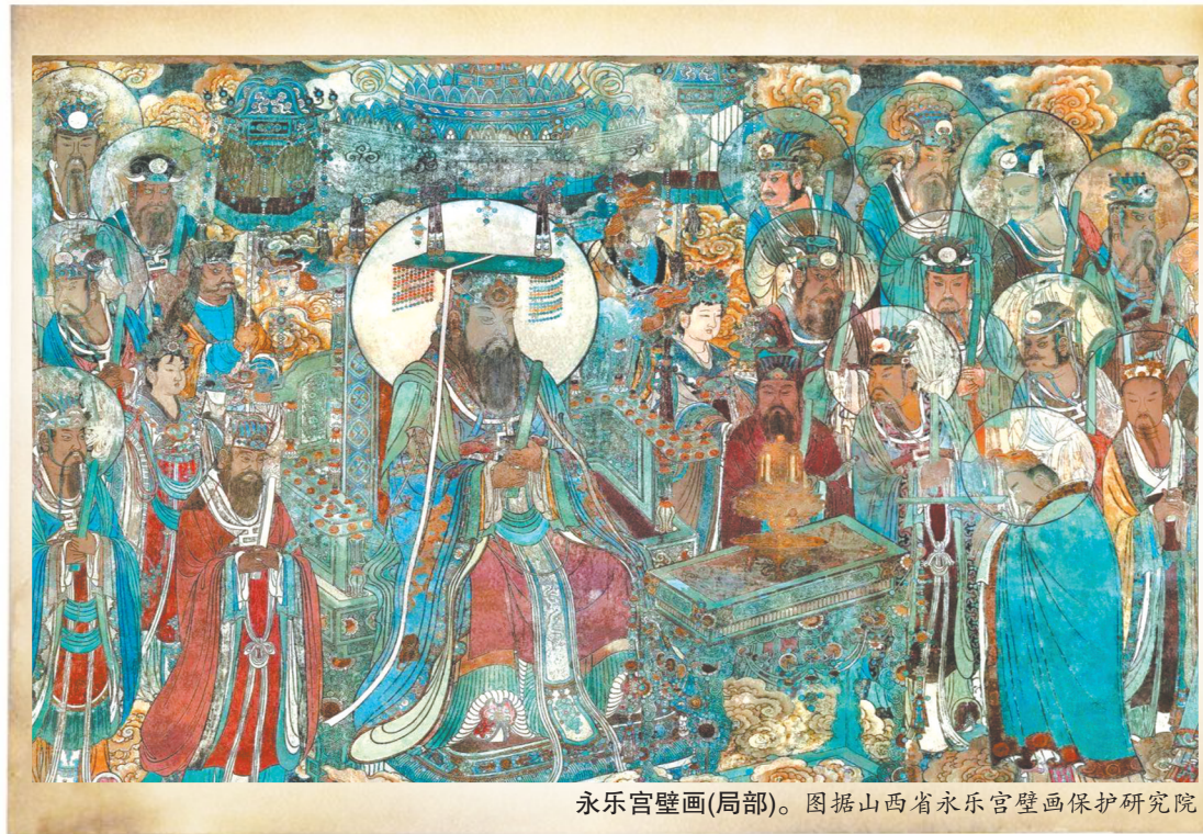
永乐宫壁画(局部)。

据猫眼专业版数据,电影《封神第一部》于2024年1月19日结束公映,累计总票房26.34亿元。在这部曾获得第36届中国电影金鸡奖最佳故事片奖的电影中,商王殷寿、姜王后、东西南北四大伯侯,他们的头冠、服饰等造型灵感都直接或间接来源于这幅《朝元图》。导演乌尔善接受记者采访时坦言,永乐宫的壁画构成了整个“封神世界”的基础。