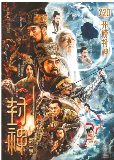
《封神第一部:朝歌风云》海报。图图片方