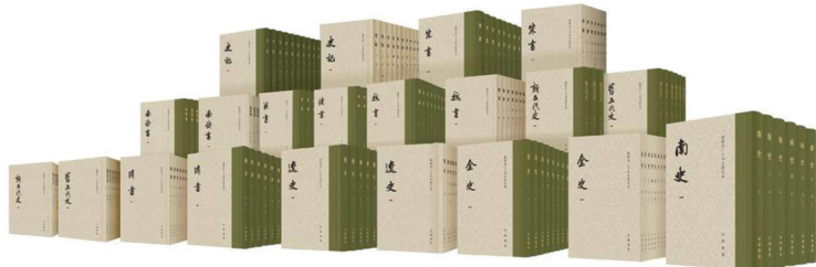
点校本“二十四史”修订工程已出版的部分。

严格流程保障质量的原则。修订工程启动之初，中华书局编辑部制定了详细的修订总则、校勘凡例和标点分段示例等，并要求承担修订工作的团队提交工作凡例、样稿，经过多轮专家审核、沟通，形成一致意见，以保障各史整体学术水准和