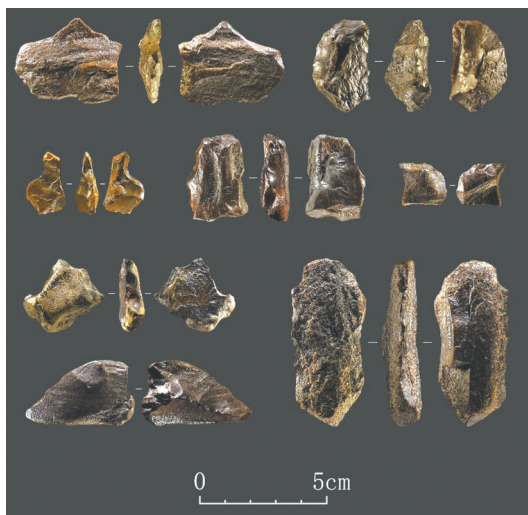
资阳濠溪河遗址出土部分石制品。

1月19日，华西都市报、封面新闻记者从国家文物局获悉，2023年度全国十大考古新发现初评启动。候选项目均为各发掘资质单位主动申报，经国家文物局审核，最终确定33项参评。其中，四川资阳濠溪河遗址、四川盐源老龙头墓地入选本次初评名单，接下来将由活动办公室投票选出20项进入终评。