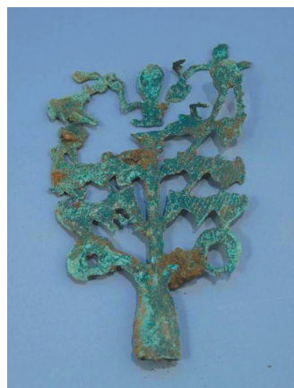
老龙头遗址出土的青铜枝形器。