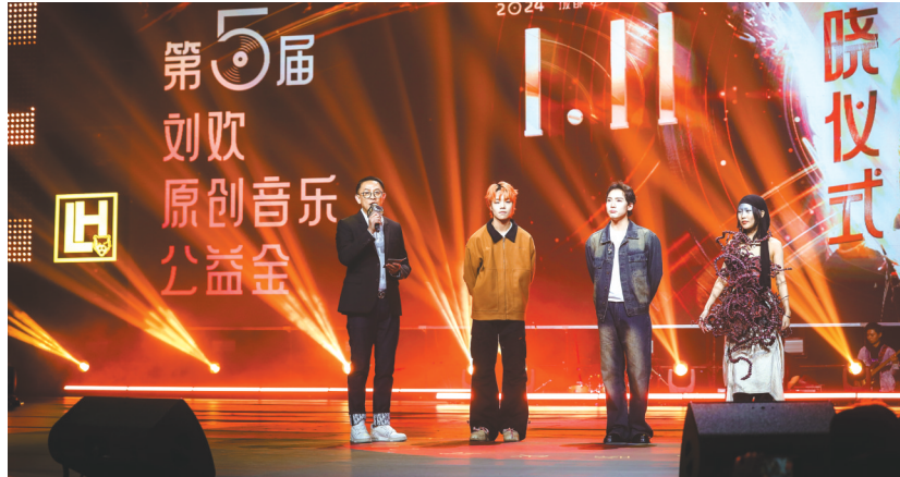
第五届“刘欢原创音乐公益金”揭晓仪式现场。

作为国内音乐综艺的引领者,《歌手》制作人洪涛聊了不少当下音综与平台在推动原创音乐上面临的难题。他认为,国内的确有很成功的音乐节目,他们推动了一大批原创音乐的诞生,例如《中国好歌曲》。但在之后就很少再有平台能真正推动国内原创音乐发展,“虽然我们看到《歌手》是一个好的音乐综艺,但老实说它对推动原创歌曲来说,由于要考虑到市场规则等诸多因素,其实并没有给原创音乐那么充分的空间。”