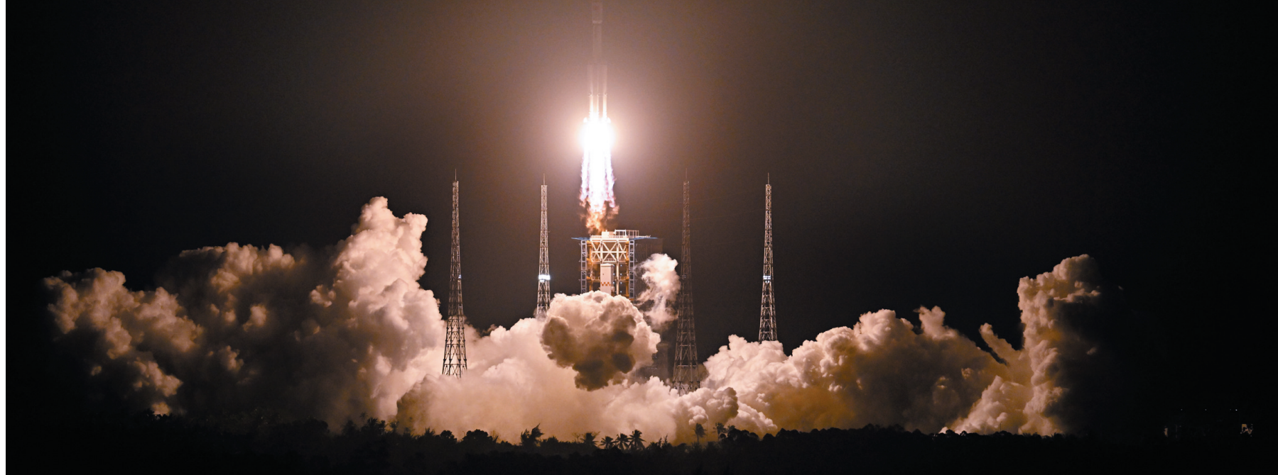
1月17日,搭载天舟七号货运飞船的长征七号遥八运载火箭,在我国文昌航天发射场点火发射。