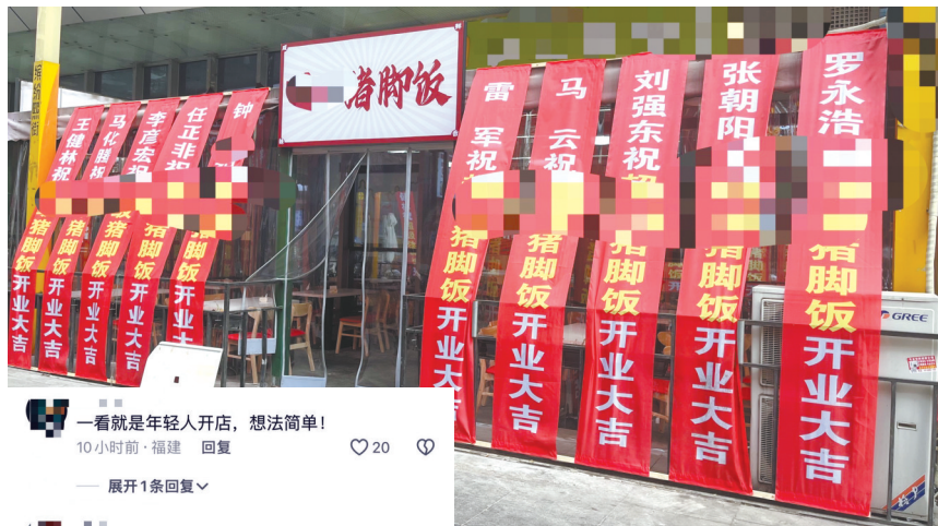
餐馆门口挂着多位商界大佬送来的“祝福”。

记者注意到，该店开业时的这些横幅引发了网友热议，有网友质疑这是商家虚假宣传，打假广告，“这种开业博取群众眼球的广告无中生有，实际是一种欺骗顾客的行为。”