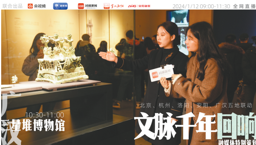
1月12日，封面新闻携手央视频、潮新闻、掌上洛阳、安阳融媒，联合推出“文脉千年回响”大型直播联动活动。

此次直播中，专业的主持人、记者纷纷化身“文明推荐官”，探寻泱泱中华的悠久历史和璀璨文明。在三星堆博物馆，浓眉大眼、高鼻阔嘴的青铜人头像，青铜大立人像精细的服装纹饰，雕饰着鸟和鱼图案的金色权杖，美丽神秘的青铜神树……随着封面新闻镜头的流转，