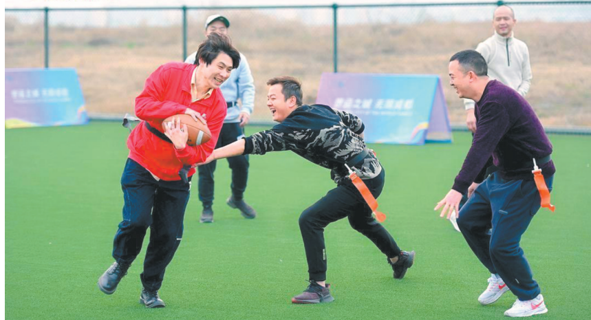
1月10日,“世运之城 无限成都”2025年第12届世界运动会“万人千场”友谊赛活动开启。图为腰旗橄榄球比赛场景。

活动还策划设置了民俗非遗体验区,糖画非遗传承人、捏面人非遗传承人、书法大师齐聚一堂,现场邀请市民嘉宾共同体验糖画、捏面人、写春联等中华传统民俗,现场热闹非凡,欢声笑语不断。