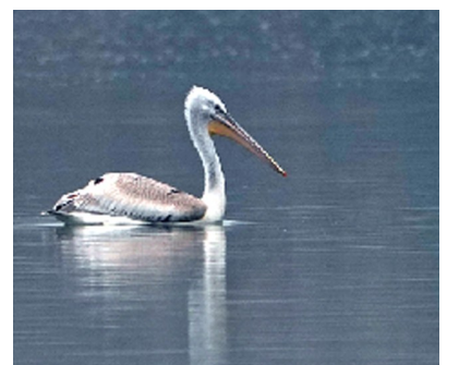
卷羽鹈鹕在水中游弋。

据了解,卷羽鹈鹕为大型涉禽,主要生活在沼泽及浅水湖等内陆淡水湿地,以鱼类为食,全长1.6米至1.8米,翼展超3米。体羽灰白,眼浅黄,喉囊橘黄或黄色,颈背具卷曲的冠羽。该鸟分布于欧洲东南部、非洲北部和亚洲东部一带,在我国见于北方,冬季迁徙至南方越冬。