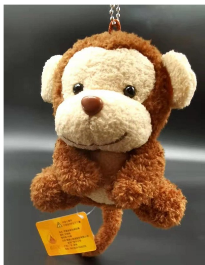
“峨眉记忆”·灵猴玩偶。

峨眉山猴子来了,还想要什么你们说”。网友们纷纷在相关视频下面留言,“四川文旅这是放大招了!”“送去和东北虎比划下,调教好了再送回峨眉。”