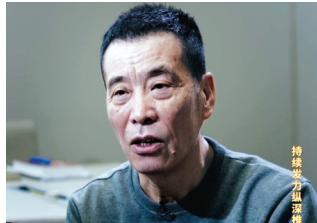
中国足球协会原主席陈戌源