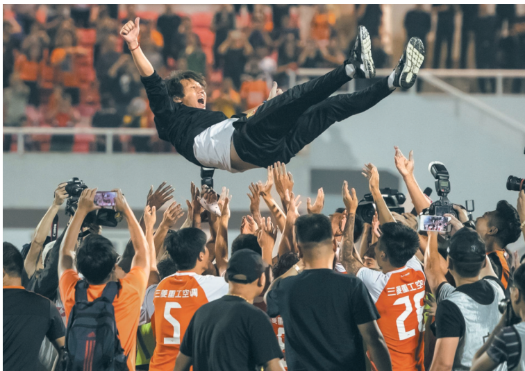
2018年，武汉卓尔冲超成功，球员赛后将主教练李铁抛起庆祝。新华社资料图片

来越急功近利。为了要取得成绩，找裁判做工作，收买对方球员、教练，变成了一种习惯。”