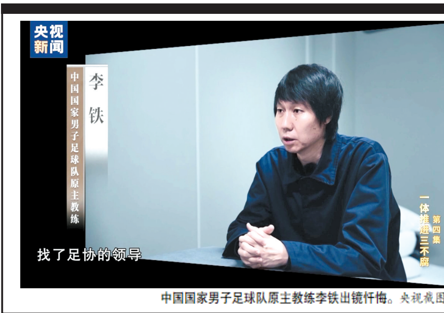
中国国家男子足球队原主教练李铁出镜忏悔。