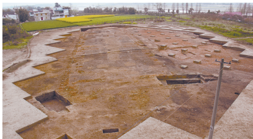
青关山一号大型建筑基址。

青关山一号大型建筑遗迹平面为长方形，呈西北—东南走向，长逾65米，宽近16米，面积超过1000平方米。这也是迄今发现的商代最大的单体建筑之一。