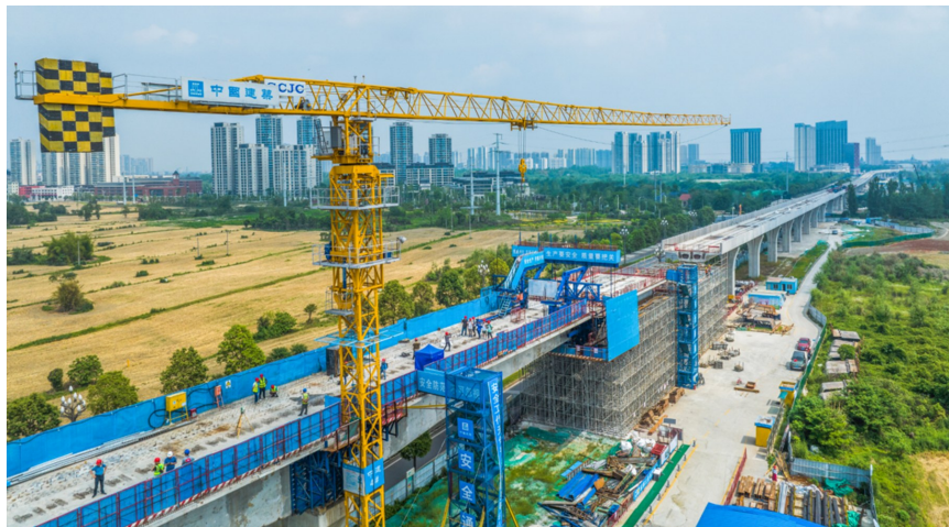
成都加速推进轨道交通在建线路建设。

截至目前,在建项目封顶车站突破114座,8号线二期全线车站已封顶,27号线一期、30号线一期全线洞通,轨道交通资阳线全线电通,成眉线1个高架站、2个地下站已进入主体结构施工。接下来,将全力推动8号线二期、27号线一期、轨道交通资阳线年内高质量开通,线网运营里程突破“650+”。此外,2024年将