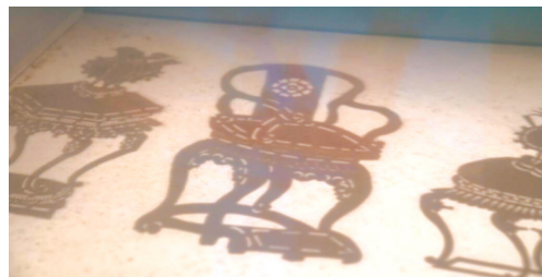
皮影投下的影子连细节也清晰可见。

发源于四川的王皮影的表演模式以川剧为主，分为小生、须生、旦角、花脸、丑角五种角色，乐器是传统的唢呐和锣鼓。“其他地方一个皮影需要两三个人才能操作，但我们一个人就可以操作两三个皮影，这是王皮影和其他流派最大的不同。”