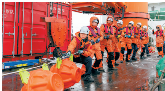
北京时间1月6日,中国第40次南极考察队在阿蒙森海成功布放深水生态潜标。