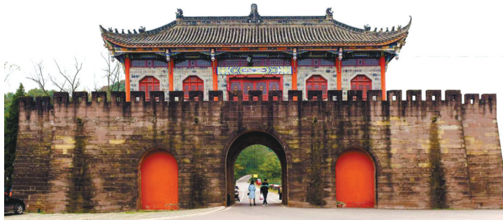
金堂云顶石城。

在宋元战争时期,有一个庞大的“川渝宋元山城防御体系”。这一体系,即13世纪南宋组织重庆和四川一带在防御蒙古军队进攻背景下营建的一系列山城要塞,它们相互呼应,以点控线,在宋元巴蜀地区的攻防战中发挥了重要作用。