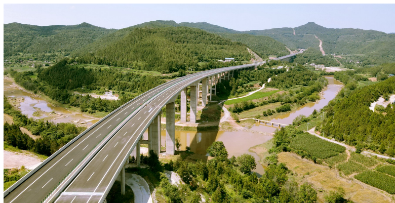
绵阳至苍溪高速公路。