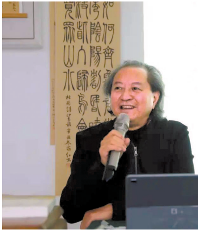
国际书法家协会首席主席刘正成

刘正成认为，视觉层面的审美是后续一切审美的基本条件，如果不把视觉的特点掌握好，就很难进入书法更深的